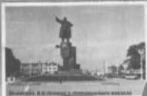
МОНУМЕНТ НЕИЗВЕСТНОЙ ГЕРОИНИЦЫ ПОВТОРИТЕЛЬНО ВОССТАВ