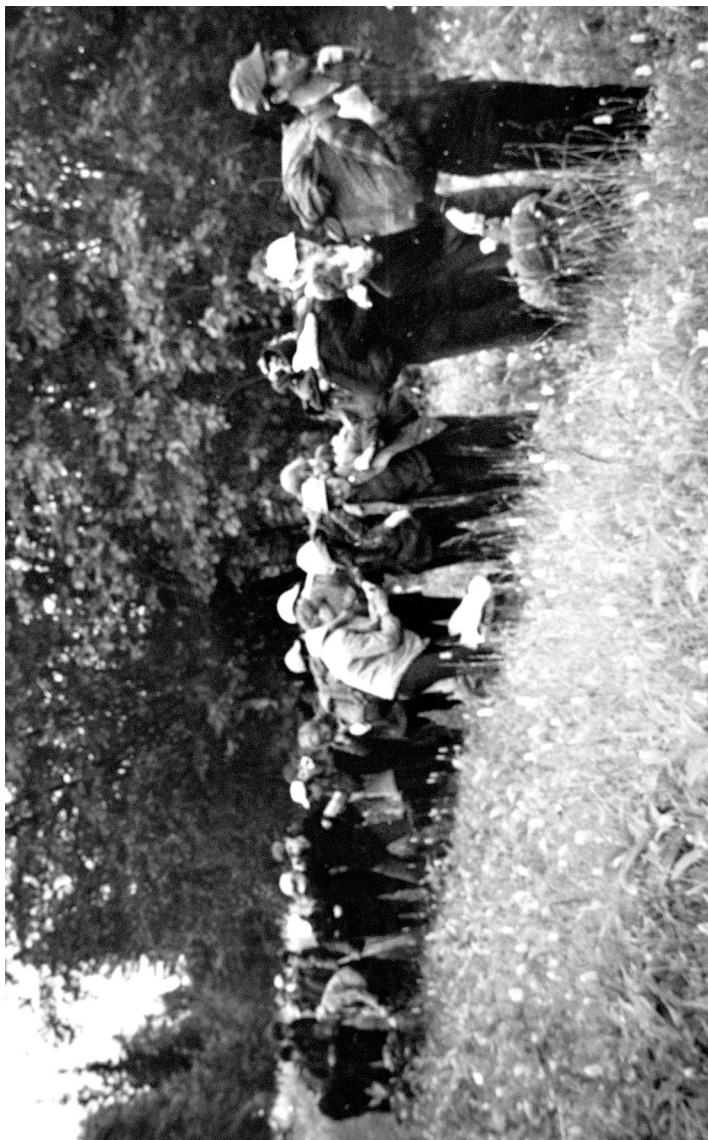
В походе по Южному Уралу (1970 год) участвовало 28 человек. Во главе колонны — А.А. Окунев. Фото Валерия Мухера.